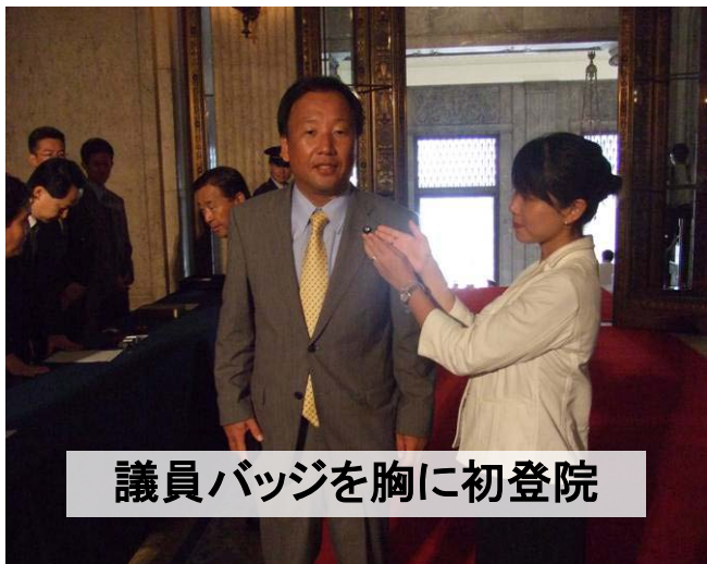
議員バッジを胸に初登院

私は皆様から頂きました、この『一票一心』をしっかりと受け止めさせて頂き、そのお心をしっかりと代弁の出来る政治家を目指して引き続き精進させて頂きます。