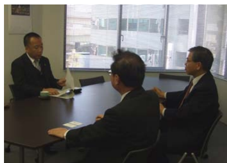
某公益法人でのヒアリング風景

昨秋話題を集めた事業仕分けに続き、4月下旬から、独立行政法人や公益法人の151事業を対象とした「事業仕分け第2弾」が始まります。これに先立ち、新人議員が中心となって872事業を事前調査。自ら「調査員」を志願した衆議院議員89名、参議院議員6名の計95名の議員は、10グループ